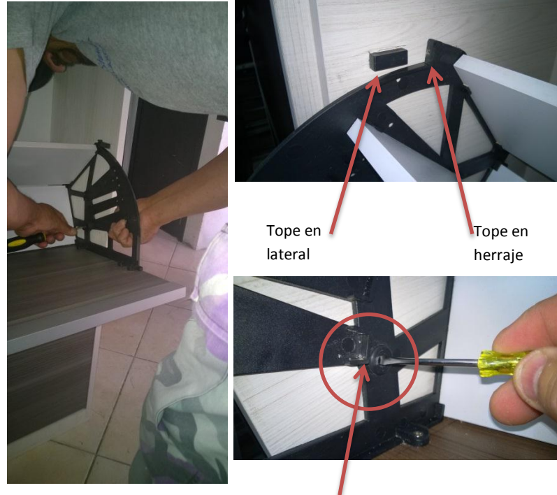
Unión de tapón con lateral del mueble